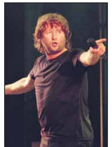
Fortsatt ledig: DDE opptre på Tørrfiskbrygga. PRESSEFOTO

har inngått et samarbeid med Brønnøy Amcar-klubb som skal arrangere et stort amcartreff i Brønnøysund i helgen. Utenfor Cubus vil det derfor bli en stor utstilling av amerikanske biler i helgen.