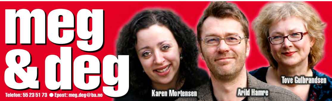
Telefon: 55 23 51 73 • Epost: meg.dag@ba.no